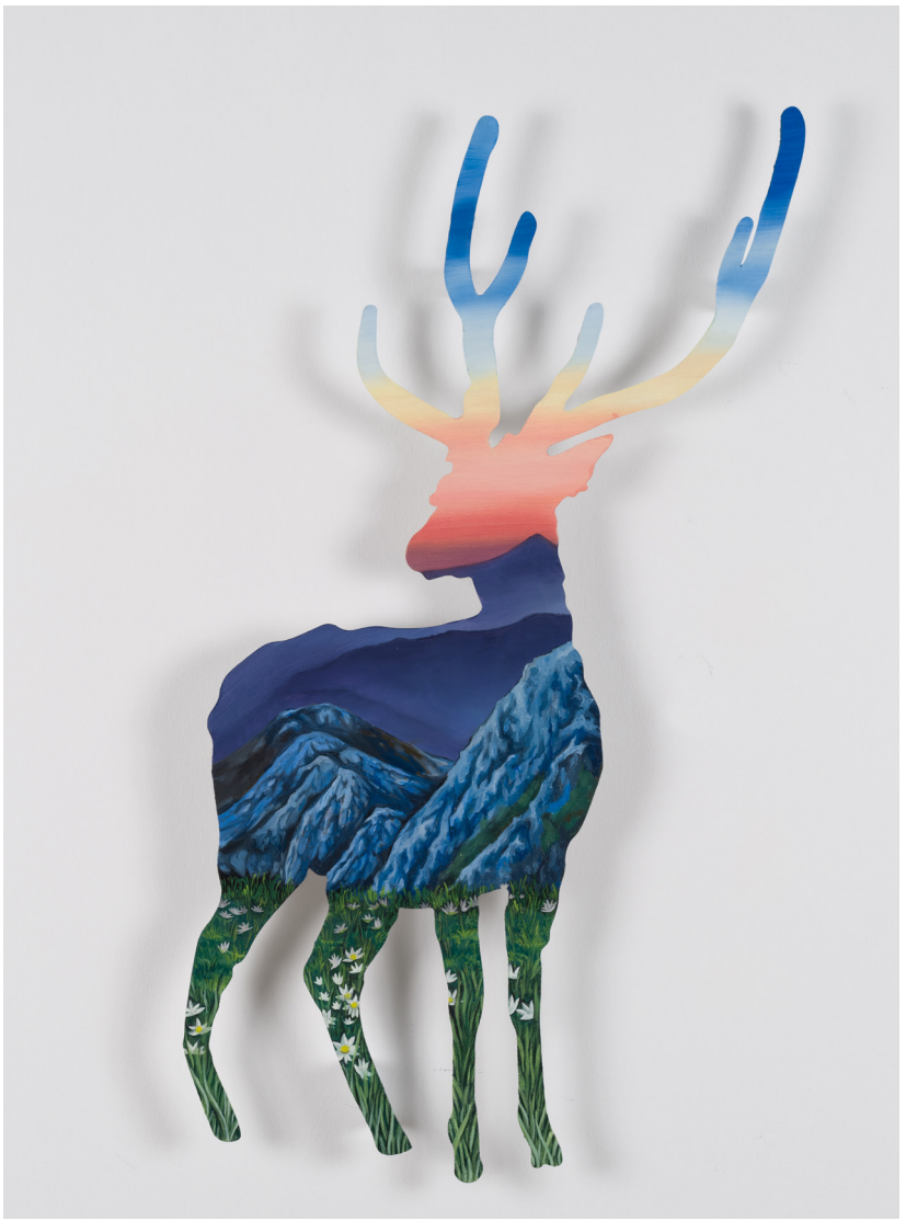
Metalin Hafifliđi Serisi II | Light Metal Series II, 2023 Alüminyum üzerine yağlı boya Oil on aluminium 80 x 51 cm