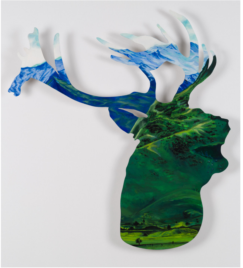
Metalin Hafifliđi Serisi VI | Light Metal Series VI, 2023 Alüminyum üzerine yağlı boya Oil on aluminium 81 x 71,5 cm