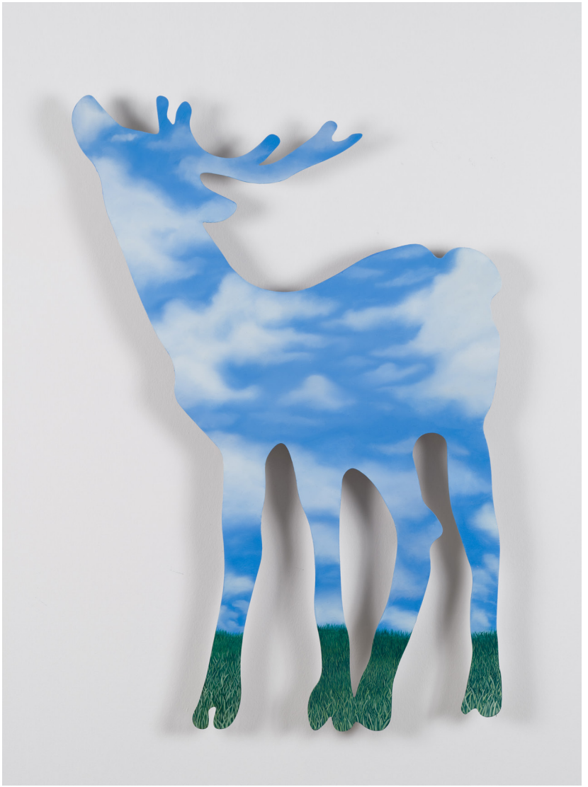
Metalin Hafifliđi Serisi III | Light Metal Series III, 2023 Alüminyum üzerine yağlı boya Oil on aluminium 80 x 62,5 cm