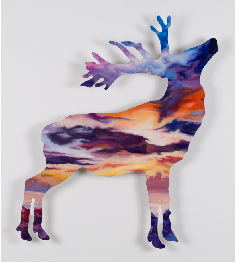
Metalin Hafifliđi Serisi V | Light Metal Series V, 2023 Alüminyum üzerine yağlı boya Oil on aluminium 80 x 63,5 cm