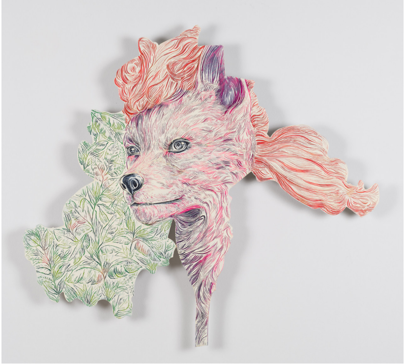
Mutasyon Serisi II | Mutation Series II, 2024 Alüminyum üzerine yağlı boya Oil on aluminium 80 x 89 cm