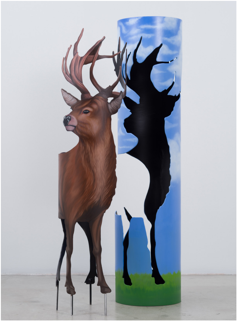
Dođanın Düşmanı Serisi I | Enemy of the Nature I, 2024 Alüminyum üzerine yağlı boya Oil on aluminium 150 x 33 x 33 cm