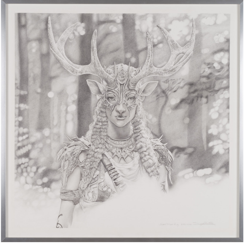
Yeni Araçlar Serisi I | New Media Series II, 2023-24 Kağıt üzerine karakalem Charcoal on paper 72,5 x 72,5 cm