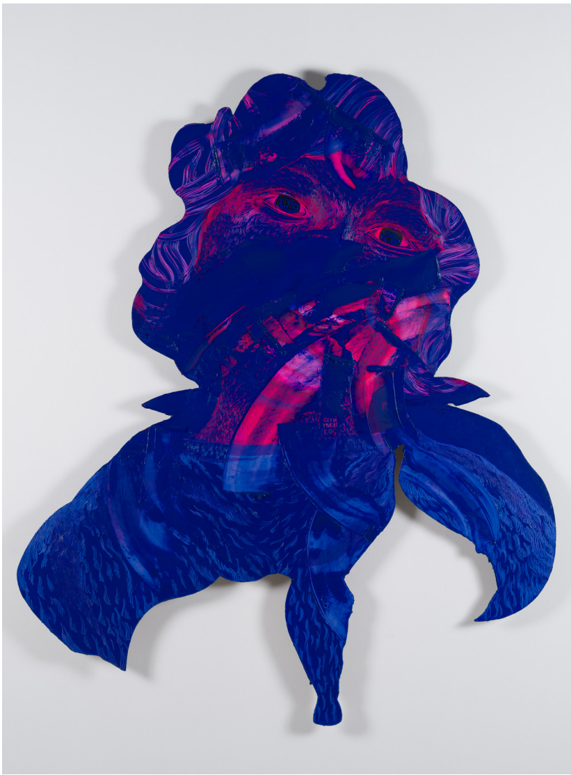
Mutasyon Serisi V | Mutation Series V, 2023 Alüminyum üzerine yağlı boya Oil on aluminium 173,5 x 143 cm