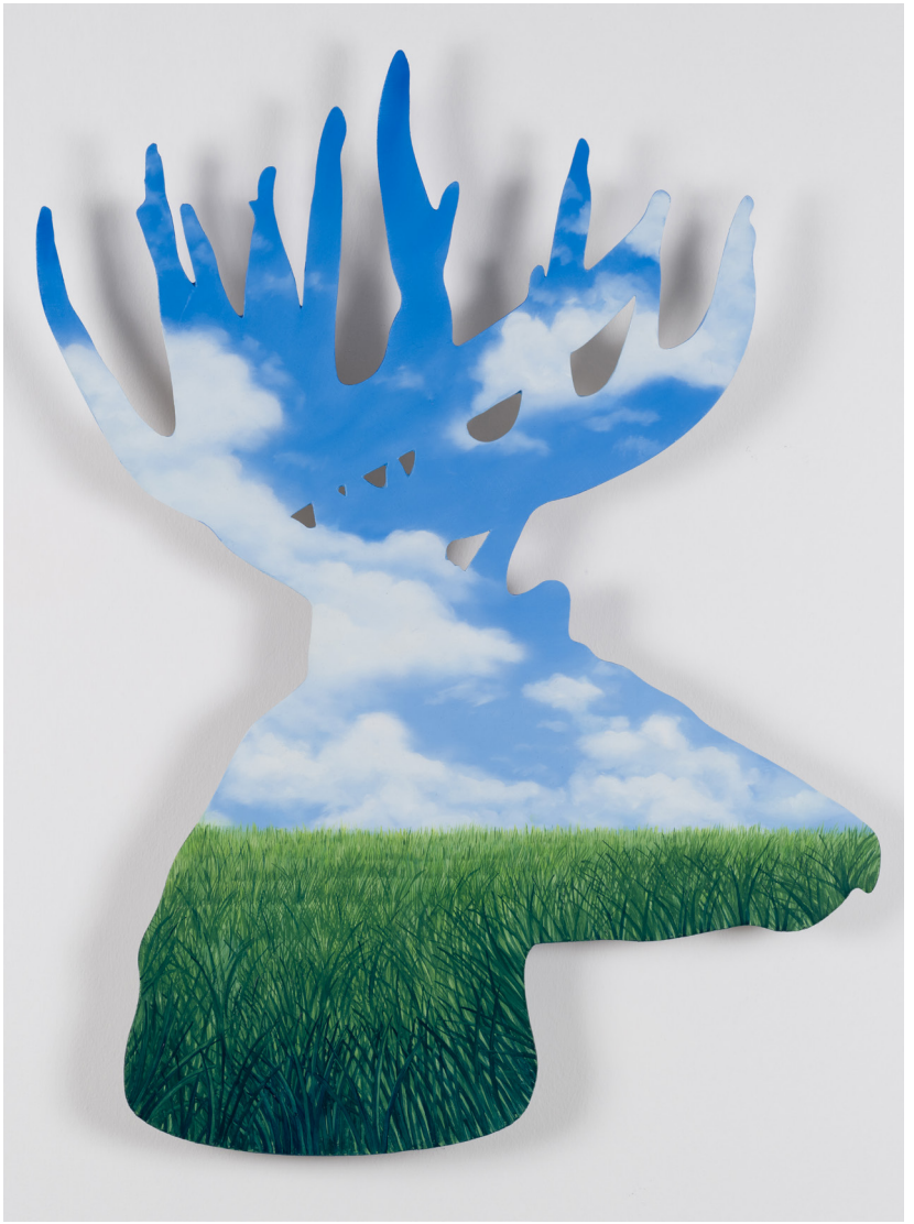
Metalin Hafifliđi Serisi IV | Light Metal Series IV, 2023 Alüminyum üzerine yağlı boya Oil on aluminium 81,5 x 61 cm