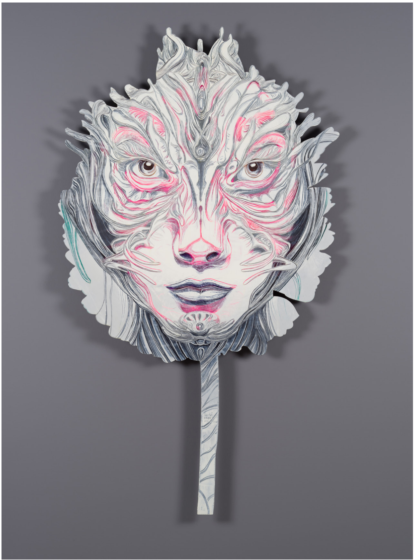
Mutasyon Serisi III | Mutation Series III, 2024 Alüminyum üzerine yağlı boya Oil on aluminium 180 x 104,5 cm