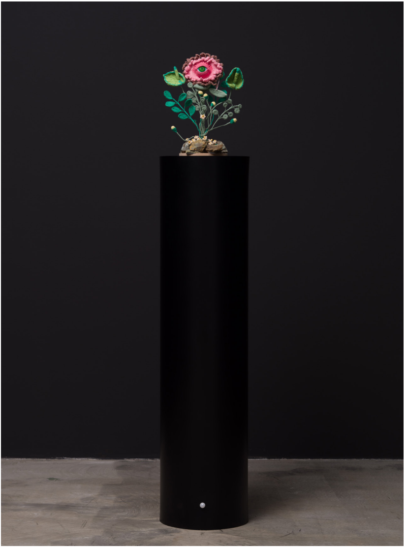
Doğanın Düşmanı Serisi II | Enemy of the Nature Series II, 2024 Alüminyum üzerine yağlı boya Oil on aluminium 130 x 132 x 132 cm