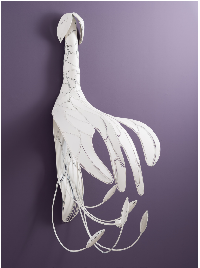
Metalin Hafifliđi Serisi VIII | Light Metal Series VIII, 2023-24 Paslanmaz elik tel, siyah sa zeri fırın boya Stainless stain wire, paint on black sheet metal 180 x 95 x 95 cm