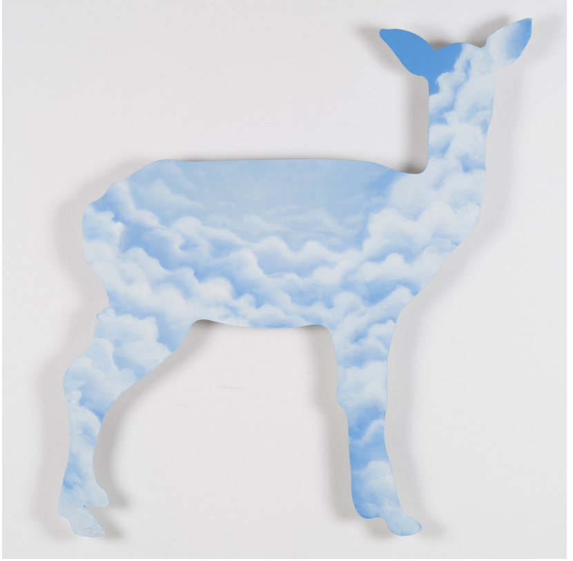
Metalin Hafifliđi Serisi VII | Light Metal Series VII, 2023 Alüminyum üzerine yağlı boya Oil on aluminium 80 x 71,5 cm