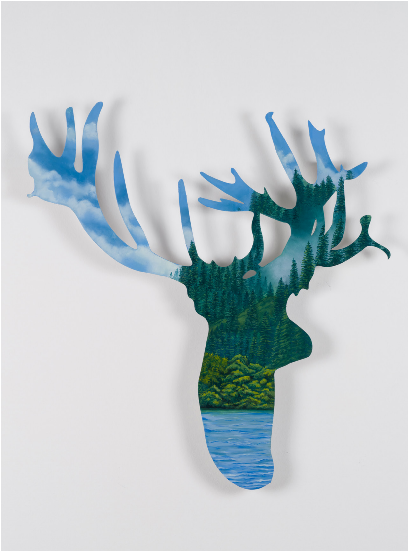
Metalin Hafifliđi Serisi I | Light Metal Series I, 2023 Alüminyum üzerine yağlı boya Oil on aluminium 80 x 74 cm