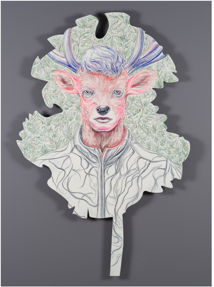
Mutasyon Serisi IV | Mutation Series IV, 2024 Alüminyum üzerine yağlı boya Oil on aluminium 180 x 119 cm