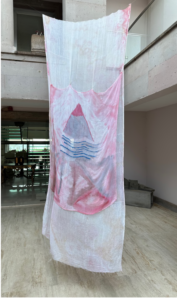
Işığın Kabuđu V, 2023 Kumaş üzerine boyama