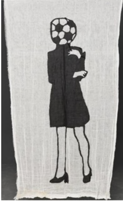
Desire Passed by Baned 7, 2010 Kumaş üzerine dikiş