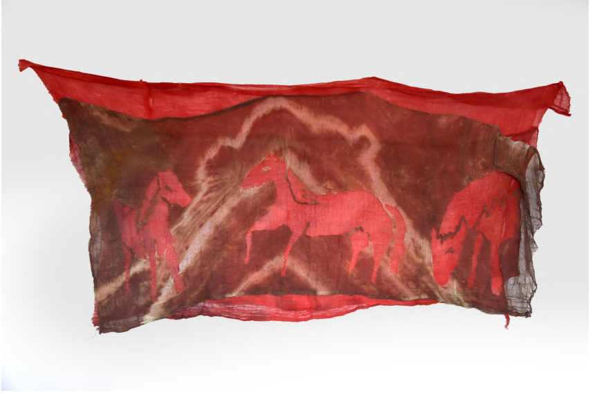
Worlbmon 16, 2019 Kumaş üzerine dikiş ve çizim