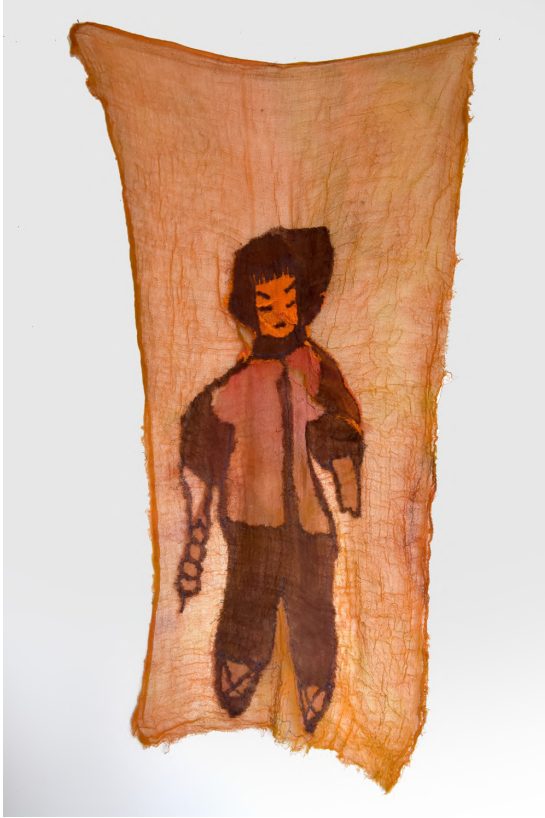
Aslan Çocuk, 2019 Kumaş üzerine dikiş