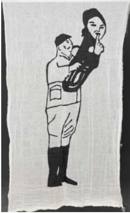
Desire Passed by Baned 5, 2010 Kumaş üzerine dikiş