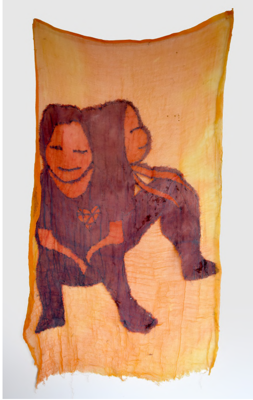
Untitled 4, 2019 Kumaş üzerine dikiş