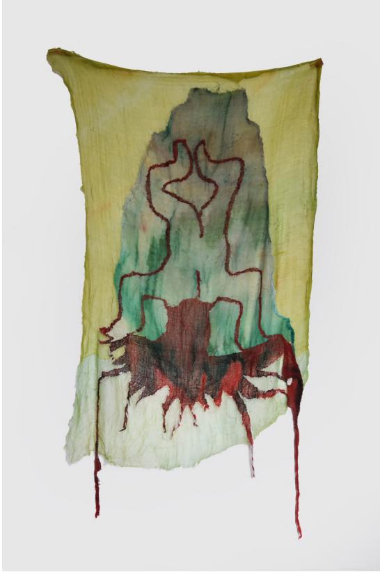
Ladies Paradise' 2, 2017 Kumaş üzerine dikiş