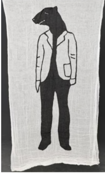
Desire Passed by Baned 6, 2010 Kumaş üzerine dikif