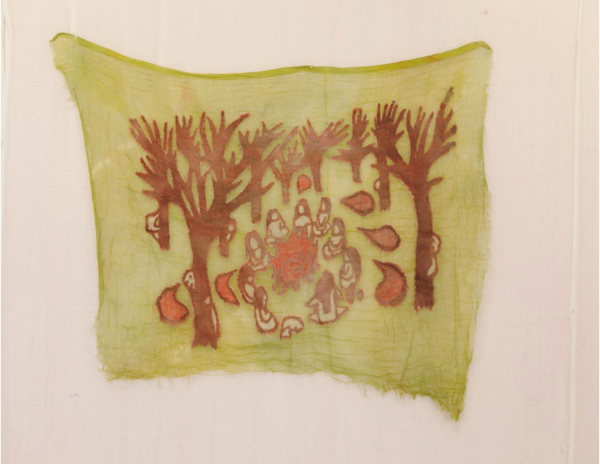
Hu Hu Hu II, 2021 Kumaş üzerine dikiş