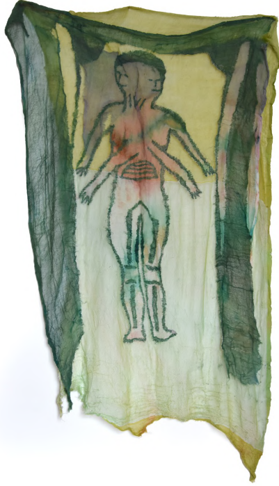
Ladies Paradise', 2017 Kumaş üzerine dikiş