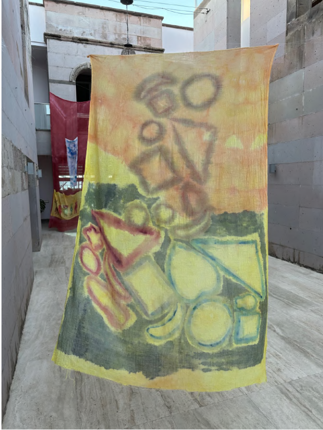
Işığın Kabuğu III, 2023 Kumaş üzerine boyama