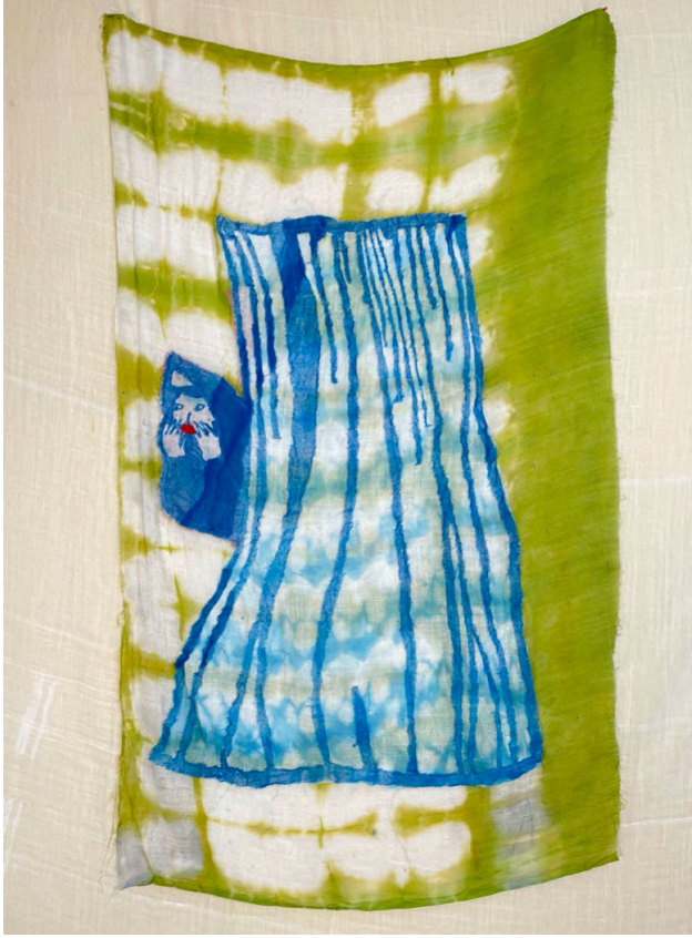
Hu Hu Hu VII, 2021 Kumaş üzerine dikiş