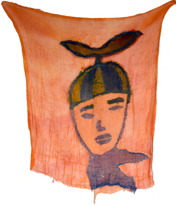
Untitled 10, 2019 Kumaş üzerine dikiş