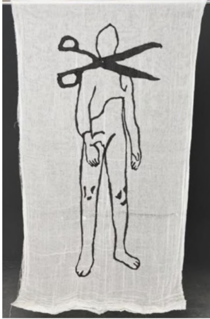
Desire Passed by Baned 10, 2010 Kumaş üzerine dikiş