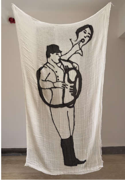
Desire Passed by Baned 17, 2010 Kumaş üzerine dikiş