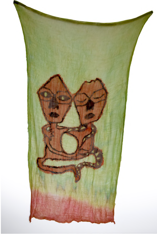
The Girl was Not Here 4, 2016 Kumaş üzerine dikiş ve çizim