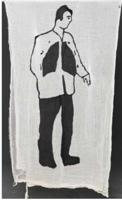
Desire Passed by Baned 11, 2010 Kumaş üzerine dikiş