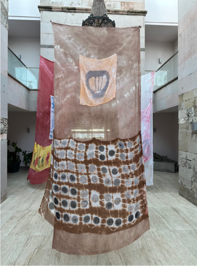
Işığın Kabuđu IV, 2023 Kumaş üzerine boyama