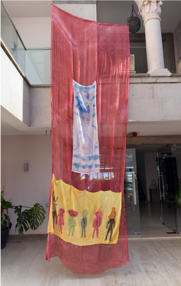
Işığın Kabuğu VI, 2023 Kumaş üzerine boyama