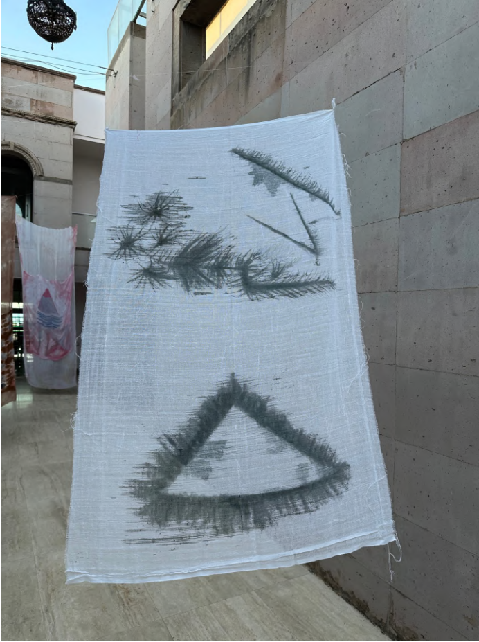
Işığın Kabuđu II, 2023 Kumaş üzerine boyama