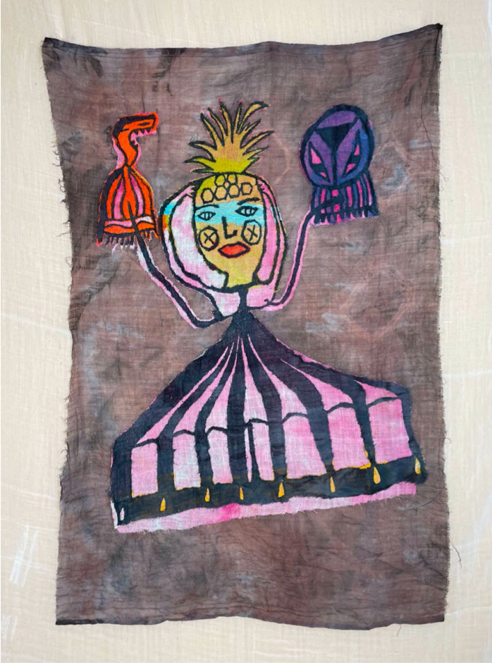
Hu Hu Hu III, 2021 Kumaş üzerine dikiş