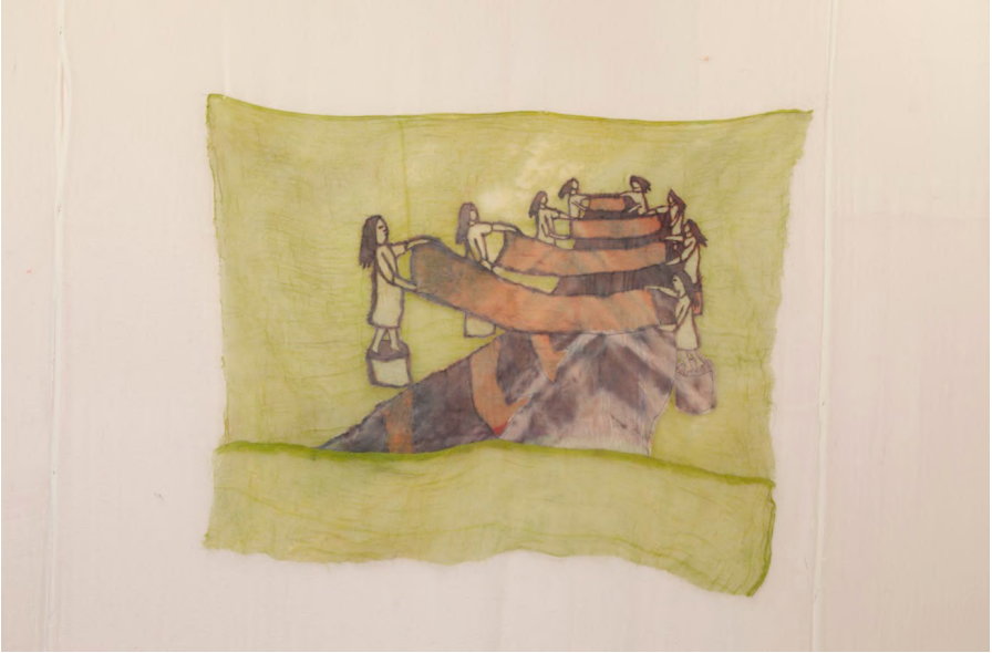
Hu Hu Hu IV, 2021 Kumaş üzerine dikiş