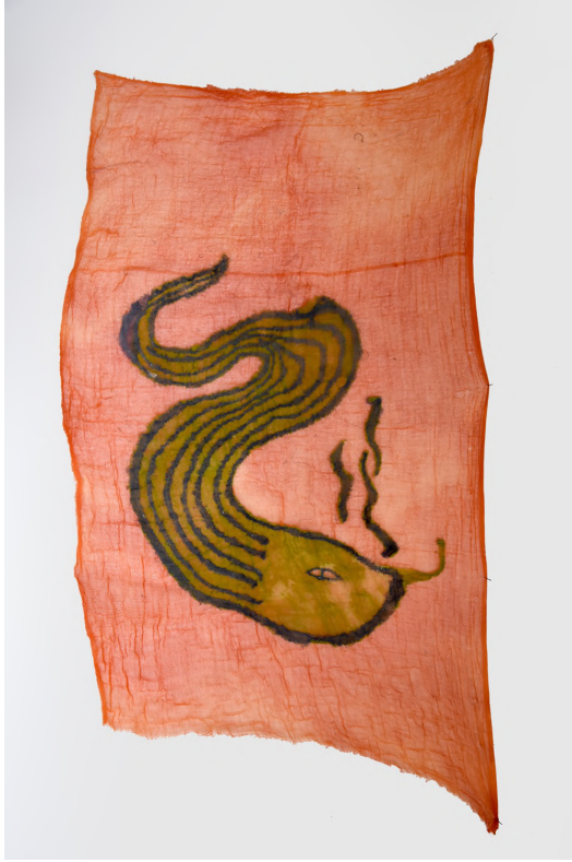
Untitled 11, 2021 Kumaş üzerine dikiş