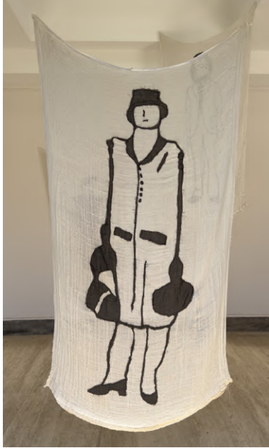
Desire Passed by Baned 18, 2010 Kumaş üzerine dikiş