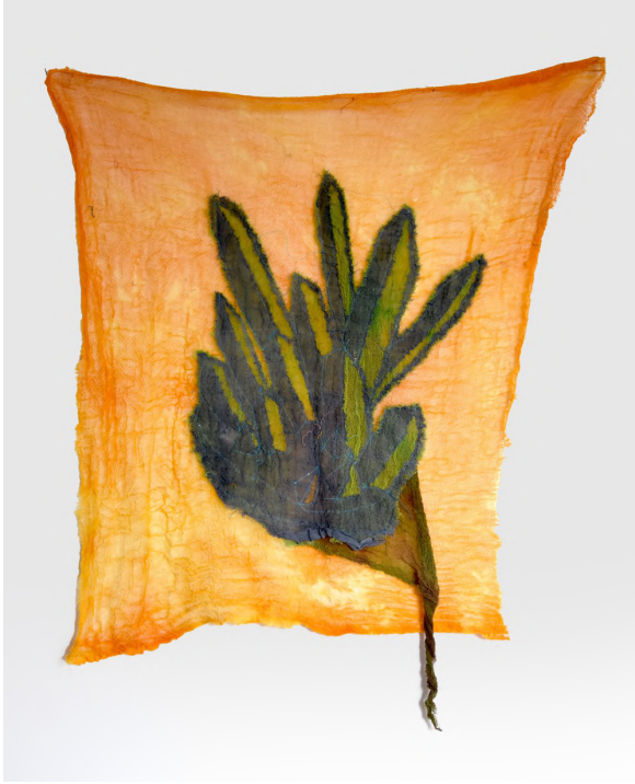
Untitled 3, 2019 Kumaş üzerine dikiş