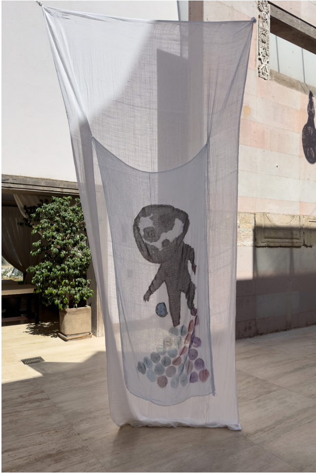
Işığın Kabuđu I, 2023 Kumaş üzerine boyama