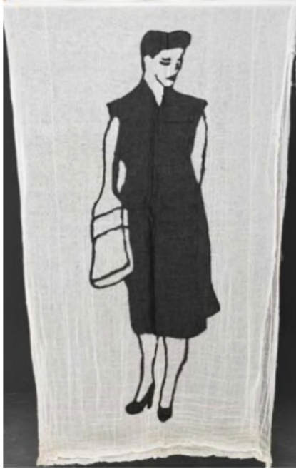
Desire Passed by Baned 14, 2010 Kumaş üzerine dikiş