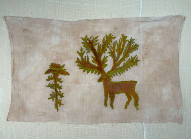
Hu Hu Hu VI, 2021 Kumaş üzerine dikiş