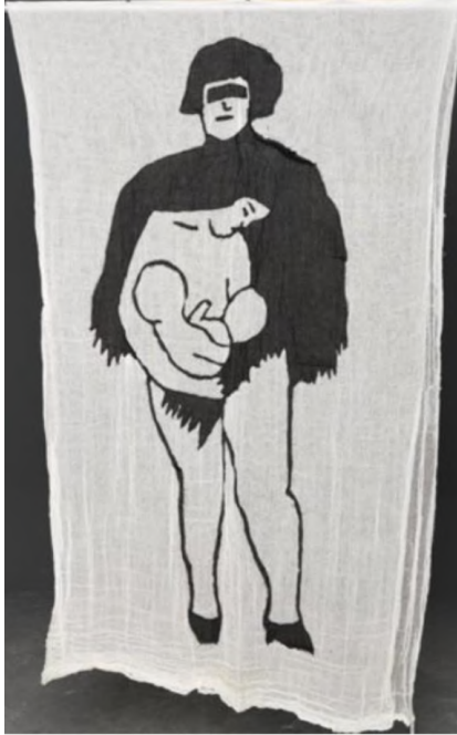
Desire Passed by Baned 3, 2010 Kumaş üzerine dikiş