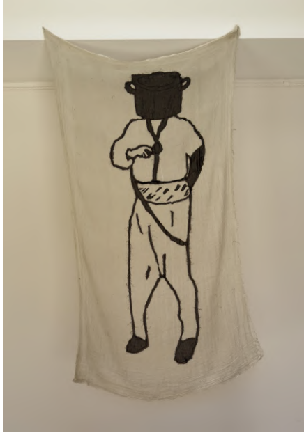
Desire Passed by Baned 15, 2010 Kumaş üzerine dikiş