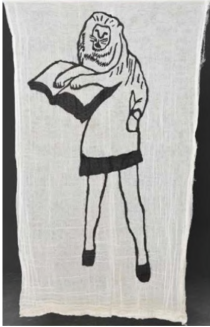
Desire Passed by Baned 4, 2010 Kumaş üzerine dikiş