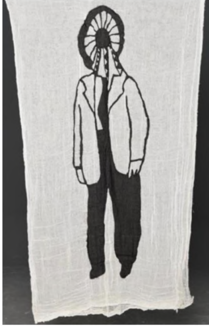
Desire Passed by Baned 8, 2010 Kumaş üzerine dikiş