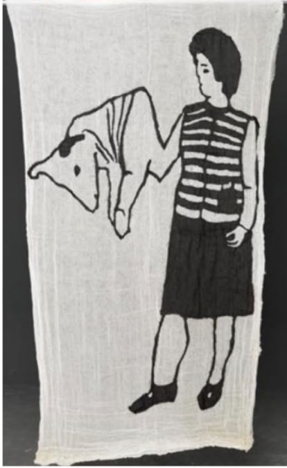
Desire Passed by Baned 9, 2010 Kumaş üzerine dikiş