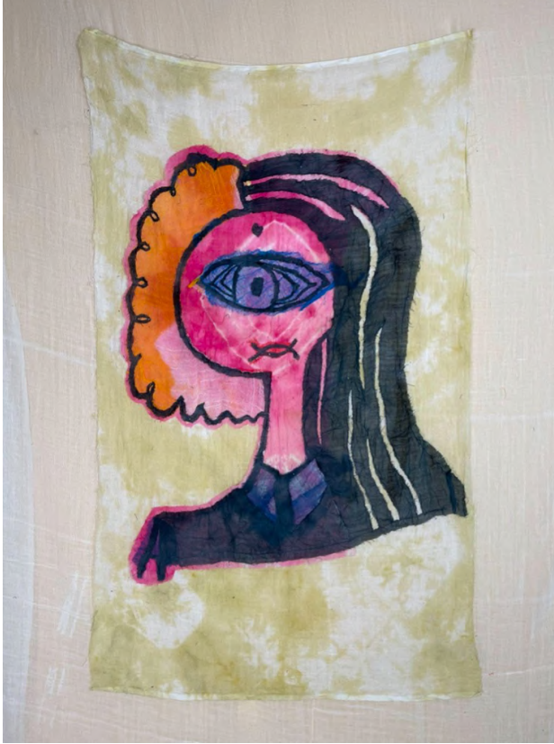
Hu Hu Hu IX, 2021 Kumaş üzerine dikiş