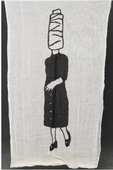
Desire Passed by Baned 12, 2010 Kumaş üzerine dikiş