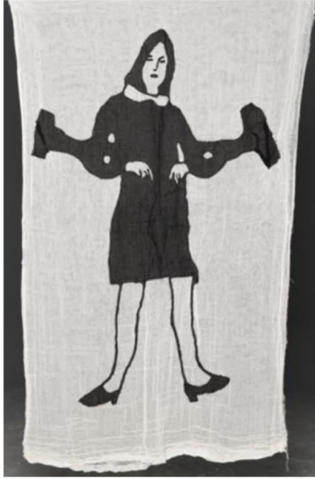
Desire Passed by Baned 13, 2010 Kumaş üzerine dikiş