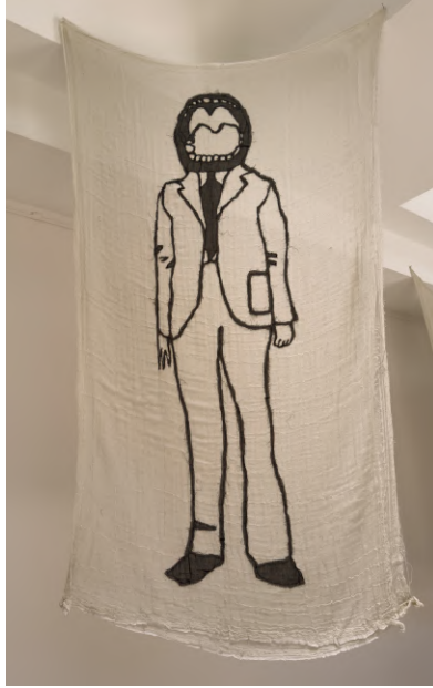
Desire Passed by Baned 16, 2010 Kumaş üzerine dikiş