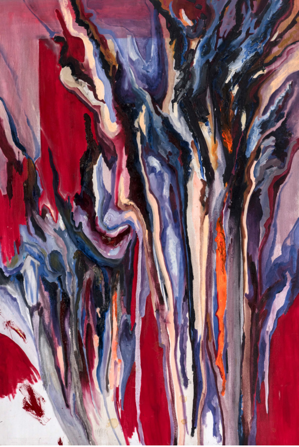
Mecnun , 2020 Tuval üzerine yağlı boya | Oil on canvas 150 x 100 cm