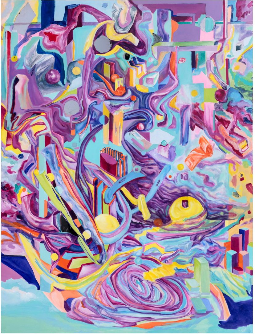
Dream / Eddy , 2020 Tuval üzerine yağlı boya | Oil on canvas 200 x 150 cm