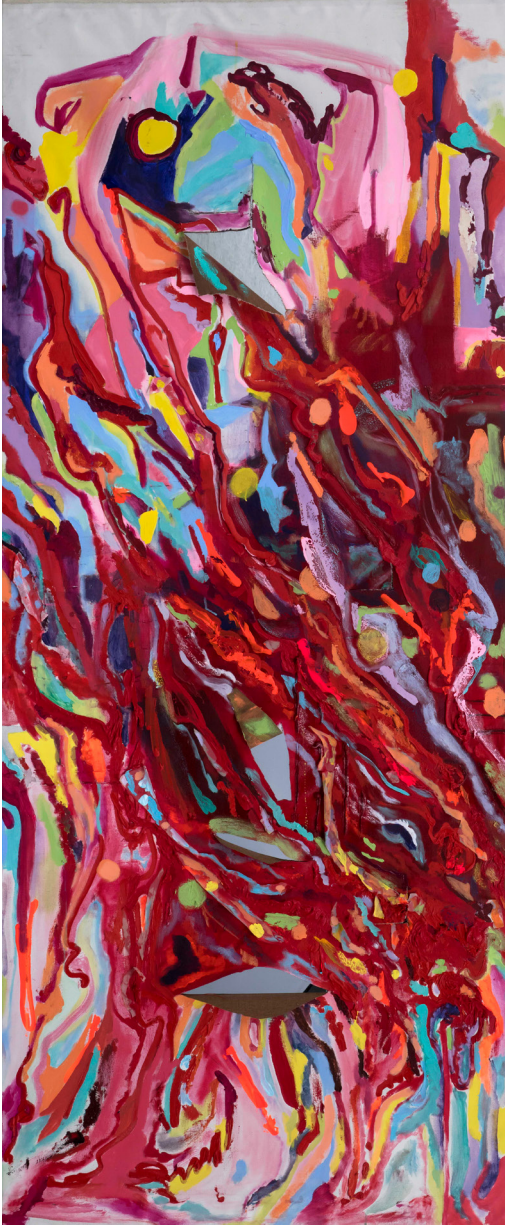
Root / Rococo , 2020 Tuval üzerine yağlı boya | Oil on canvas 215 x 90 cm