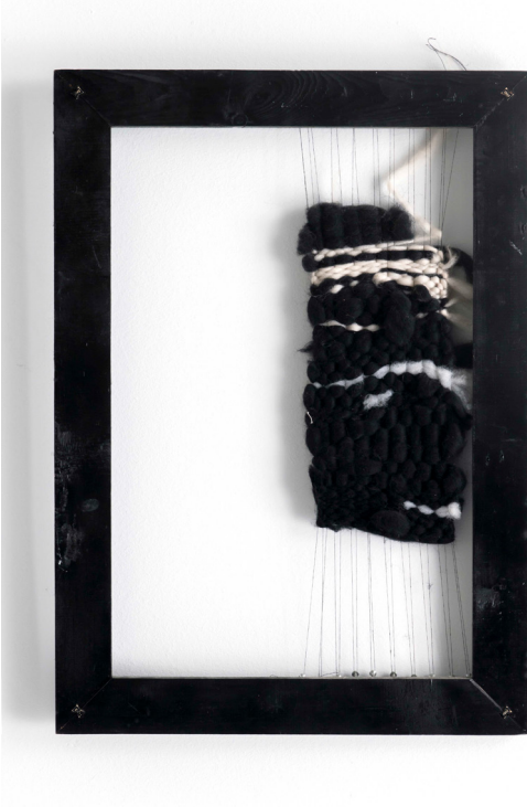
Leila-I , 2020 Karıřık teknik | Mixed media 70 x 50 cm