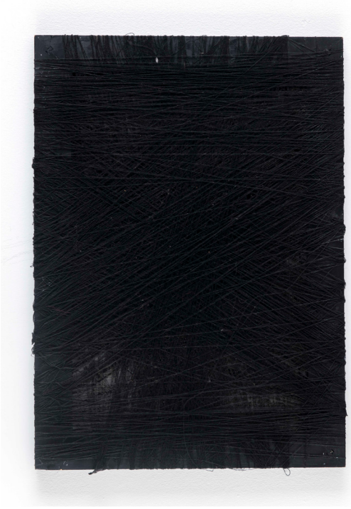
Leila-II , 2020 Karıřık teknik | Mixed media 70 x 50 cm