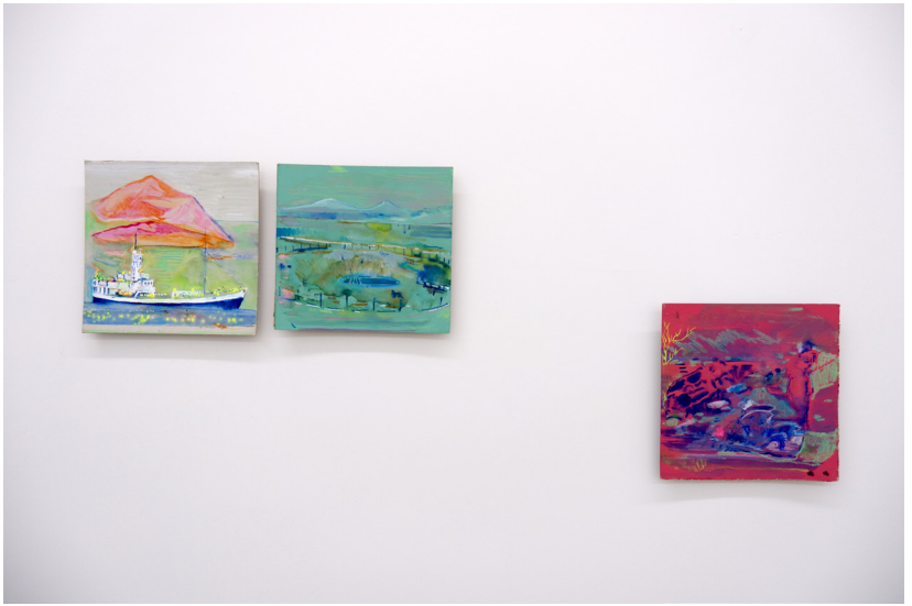
İsimsiz | Untitled, 2022 25,5 x 25,5 cm (Her biri | Each)