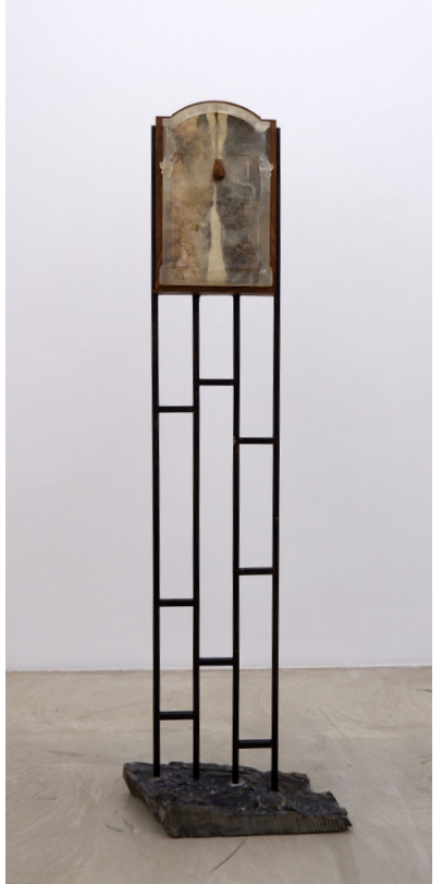
Agna Groung, 2022 Sabun, asetate baskı, gül ceviz Soap, acetate print, rose, walnut 42 x 27 x 6 cm